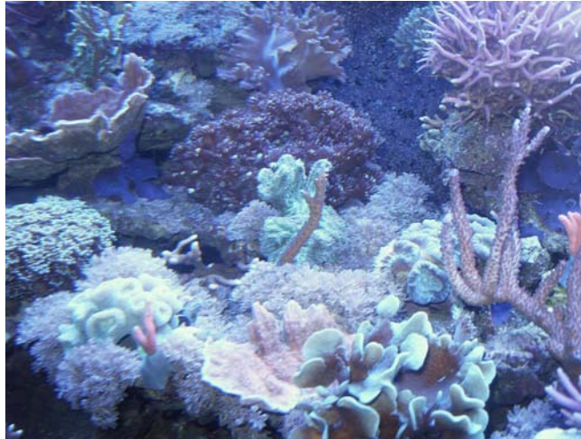
Liebi Griess' Walti

Die Kombination dieser neuen Coral-Shop-Produkte zusammen mit den Korallenzucht-Produkten hat bei mir bis jetzt die besten Resultate gebracht und ich kann diese neuen Spuri's nur weiterempfehlen.